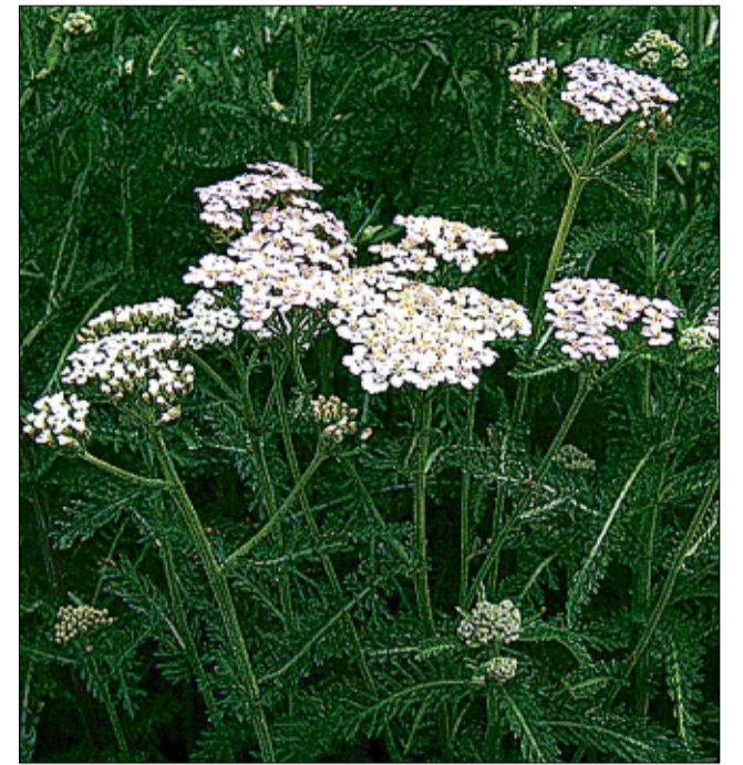
Schafgarbe wird auch Soldatenkraut genannt.

und kompetente Ratgeberin für medizinische Fragen der „nordisch gesund“-Redaktion, wird ab dieser Sommerausgabe in lockerer Folge passend zur Jahreszeit jeweils eine heimische Heilpflanze vorstellen und die Heilwirkung erläutern. Dazu gibt es praktische Tipps zur eigenen Herstellung von heilkräftigen Tees, Ölen und Tinkturen. Frei nach dem Motto: „Es gibt nur eine Heilkraft, und das ist die Natur.“ Arthur Schopenhauer, deutscher Philosoph (1788 - 1860). (eik)