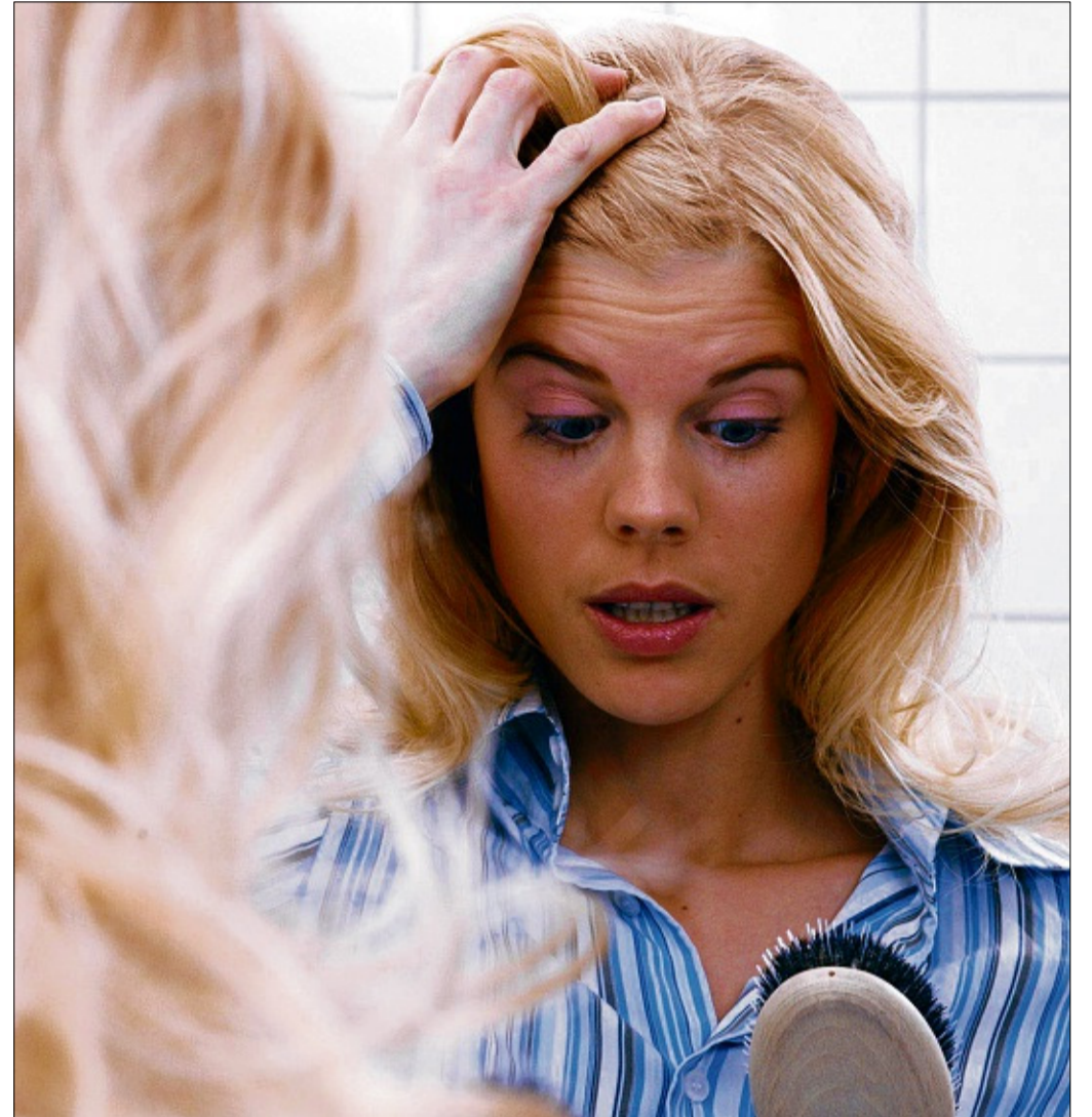
Kein Grund zur Panik: Bis zu 100 Haare können am Tag verloren werden, ohne dass es problematisch werden muss.

Regelmäßiges Haarschneiden kann Haarausfall übrigens nicht vorbeugen, wie manche meinen: Haarausfall entsteht direkt an der Haarwurzel und wird nicht von der Haarlänge beeinflusst. Zu enge Hauben und Kappen und sehr stramme Zöpfe – über einen längeren Zeitraum getragen – können Haarausfall allerdings begünstigen. Zu den weiteren Behandlungsmöglichkeiten von Haarausfall gehört die 1952 von dem französischen Arzt Dr. Michel Pistor entwickelte Mesotherapie. Mit 50 bis 100 Mini-Einstichen werden die Wirkstoffe in mehreren Sitzungen mit einer feinen Nadel in die Kopfhaut eingebracht, und zwar direkt an die Papillen. Diese kleinen Hautzapfen sind für die Versorgung der Haare mit Nähr- und Botenstoffen zuständig.