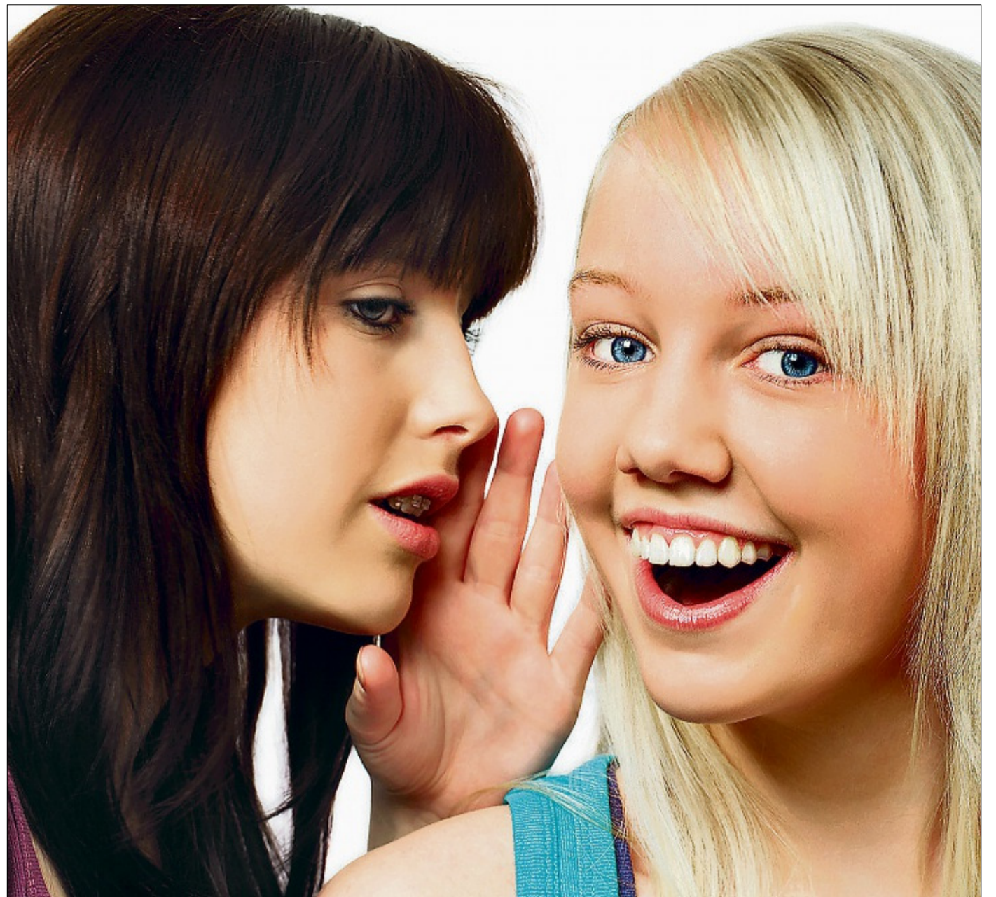
„Du bist einzigartig!“ Eine ähnliche Botschaft könnte die Brünette der Blondine bald zuflüstern.

Ursprünglich ist die helle Haut- und Haarvariante durch eine Genmutation entstanden und entpuppte sich im lichtarmen Nordeuropa bald als Überlebensvorteil. Denn um lebensnotwendiges Vitamin D zu bilden, braucht der Mensch UV-Licht. Schwächer pigmentierte Menschen mit heller Hautfarbe werden besser durchdrungen als dunkle Hauttypen. In Schweden ist daher heute noch ein Drittel der Bevölkerung blond, in Äquatornähe