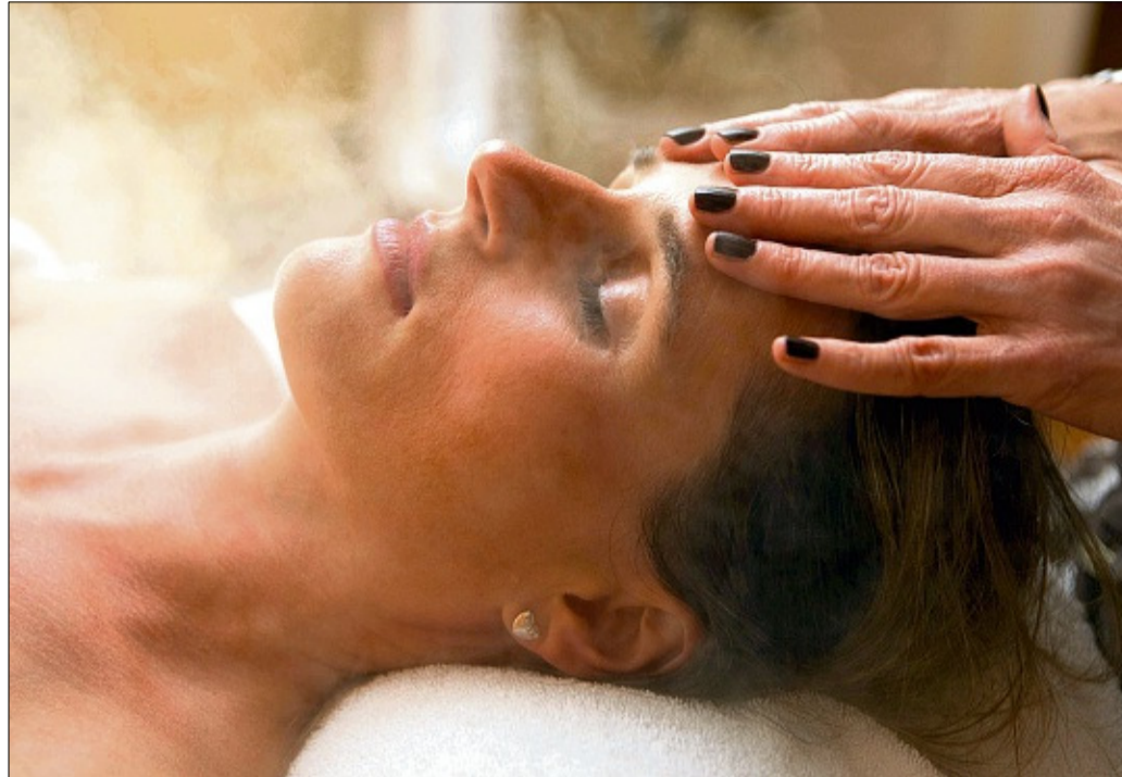
Dicht dran am Körper ihrer Kunden sind die Kosmetikerinnen und Friseurinnen. Diese Nähe schafft die Basis, um während eines Beauty-Termins auch über private Sorgen zu sprechen.

Der dadurch im Alltag aufgestaute Frust entlädt sich ungefiltert zwischen Dampfbehandlung und der Suche nach zu beseitigenden Missetzern, oder zwischen Schneiden und Strähnen. Dazu kommen unerfüllbare Ansprüche. „Ein neuer Haarschnitt reicht nicht aus, um ein neuer Mensch zu werden