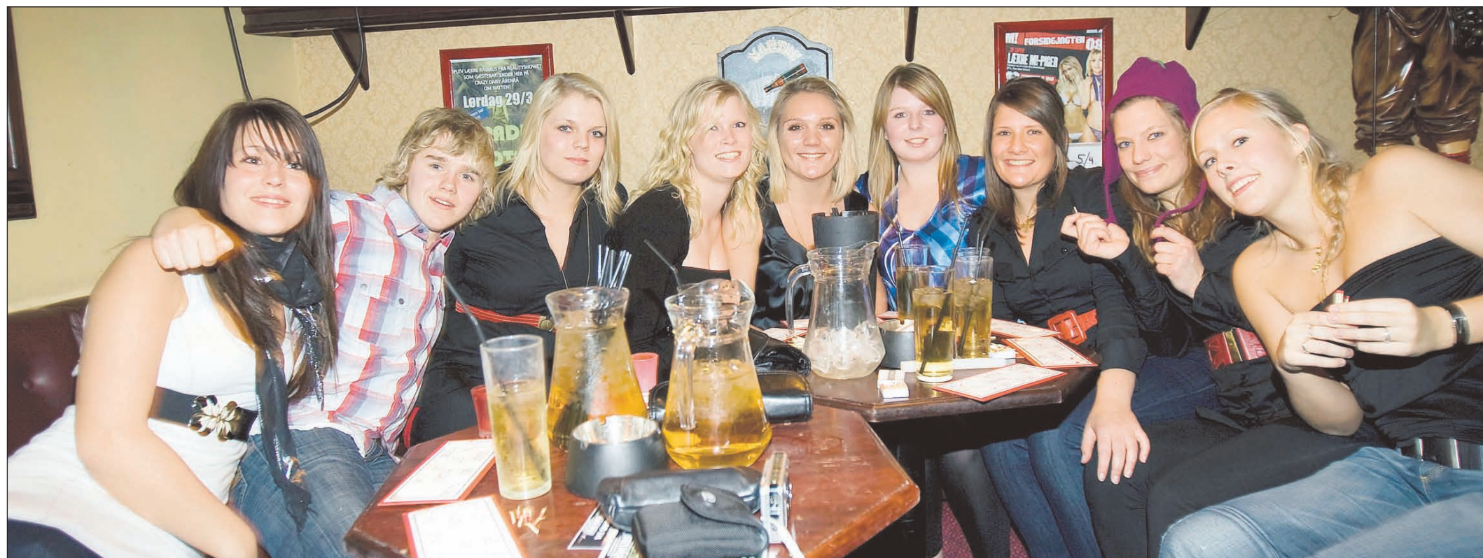
Med drinks i kanden og drikke-bingo har tusegruppen (hvor der også er plads til en ungersvend) det sjovt i diskotek »Crazy Daisy«.