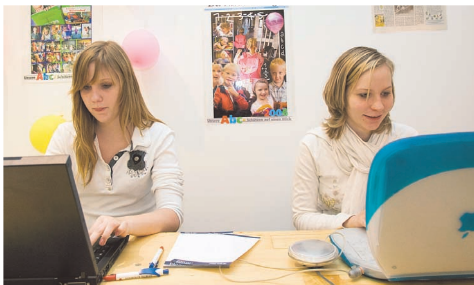
Skriveværkstedet var godt besøgt på begge aktionsdage. Både tyskere, danskere, mindretalstyskere- og danskere samt tyrkere deltog i projektet.

Dies würde zwar eventuell zu einem Anstieg der Kaffeepreise, auch für uns, führen, aber schließlich wurde ja gerade der Butterpreis gesenkt, und wenn man dem Fernsehen Glauben schenken darf, geht Tierschutz ja uns alle an.