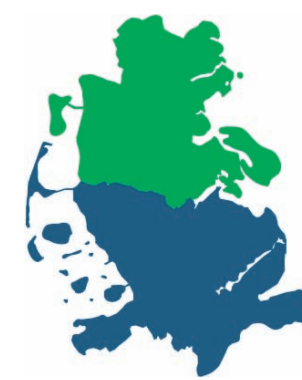
BLANDT NABOER - UNTER NACHBARN

- Der er et kursus, vi kan komme på, men det begyn-