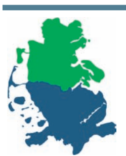
BLANDT NABOER - UNTER NACHBARN

Syd for grænsen holdes talerne først efter hovedretten, sketches og andre indlæg må vente, til tallerkenerne er taget fra bordet.