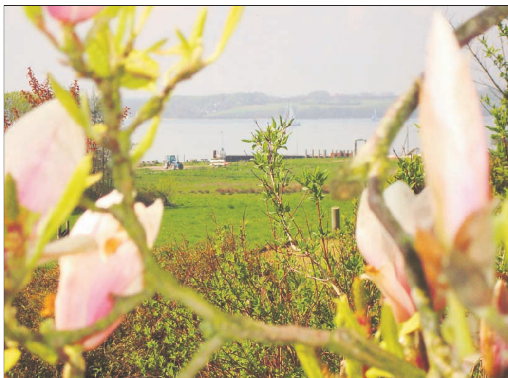
Barsø byder på en flot udsigt ud over Østersøen.

- Det var en stor omstilling for mig at flytte fra storbyen København ud på havet. Kontrasten kunne ikke have været større. Men