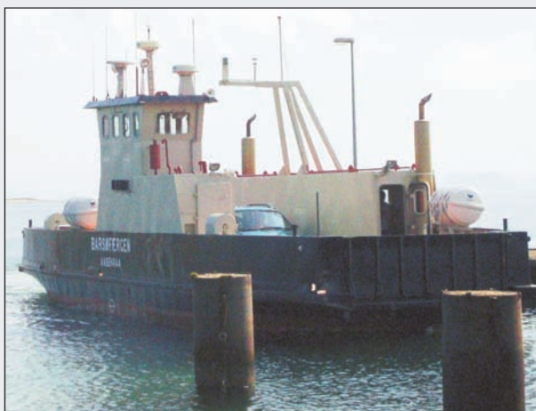
Den lille Barsø-færgen lægger til.

Afgang: Barsø Landing (ca. ti kilometer nord for Aabenraa).