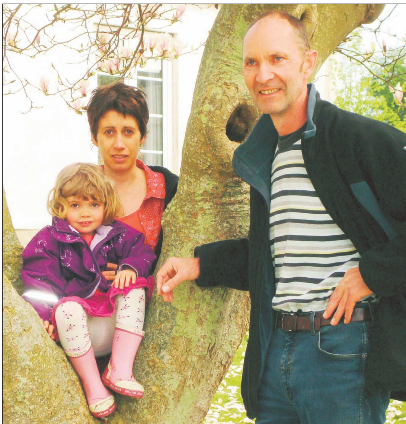
Familien Nissen/Pedersen kan ikke forestille sig et liv på fastlandet.