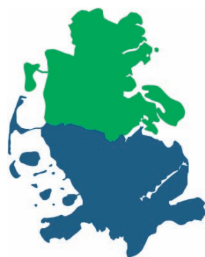
BLANDT NABOER - UNTER NACHBARN