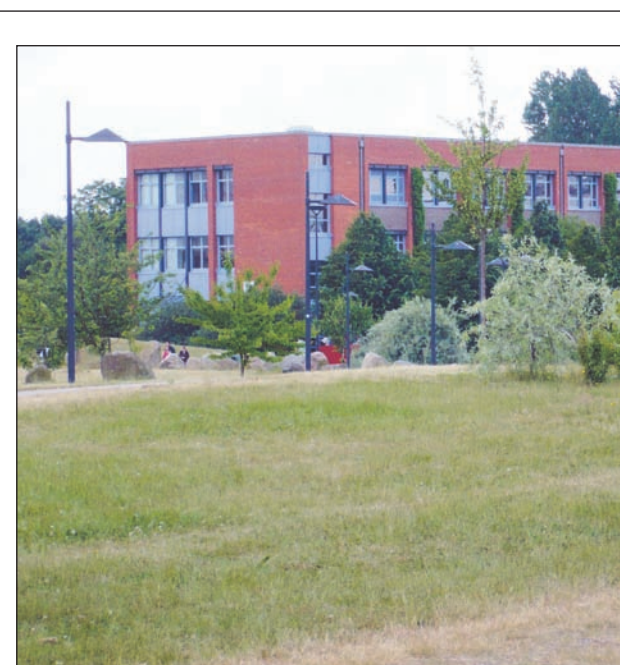
Grønt areal: Flensborgs campus.

Kombinationen af universitet, anvendt forskning og kulturmiljø er ifølge professoren »meget attraktivt for os«, især med henblik på Sønderborgs Campus, der udover station, forskerpark, koncertsal og prøvelokaler for Sønderjyllands Symfoniorkester råder over et såkaldt clean room (kemisk rent rum) og en cafe. SDU ser især store fordele i forskerparken, der modtager støtte fra Danfoss-koncernen. Men denne specielle blanding rummer også