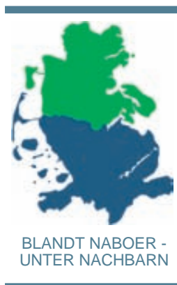
BLANDT NABOER - UNTER NACHBARN

Den tætte kontakt til den lille børnehaven og informationstavler i vuggestuen betyder, at forældrene lø-