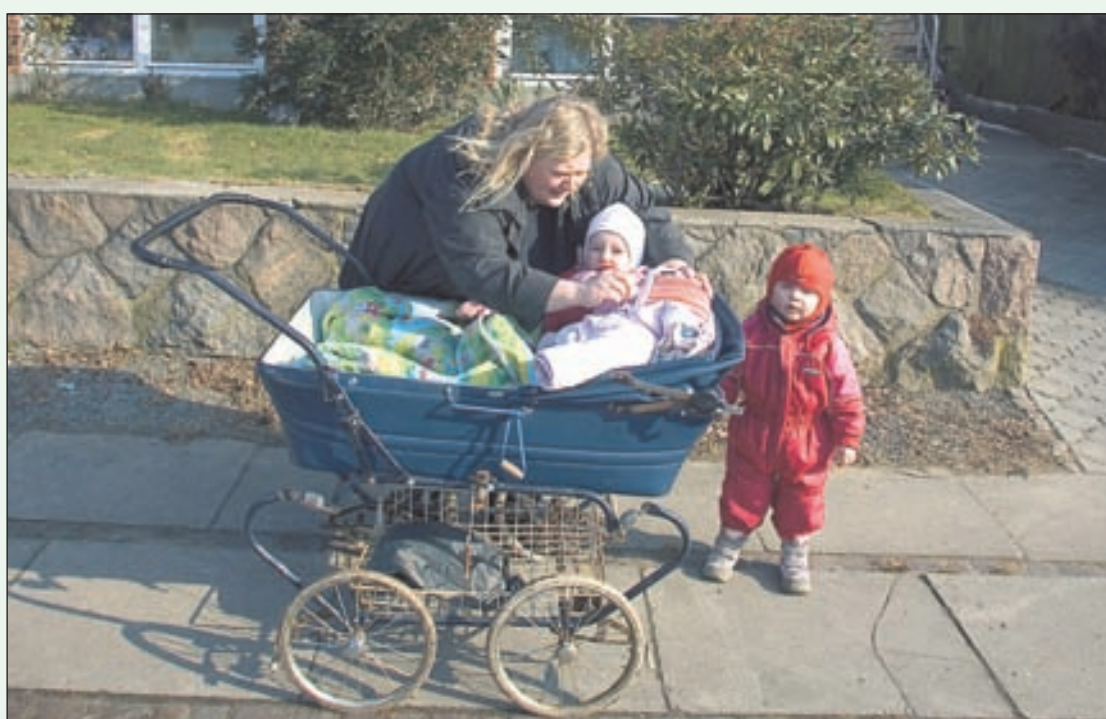
I Danmark er der pasningsgaranti til børn mellem seks måneder og frem til skolealderen. Her er en dansk dagplejemor i aktion.

• Institutionerne holder som regel åbent kl. 6.30-17.00, om fredagen til klokken 16. Der