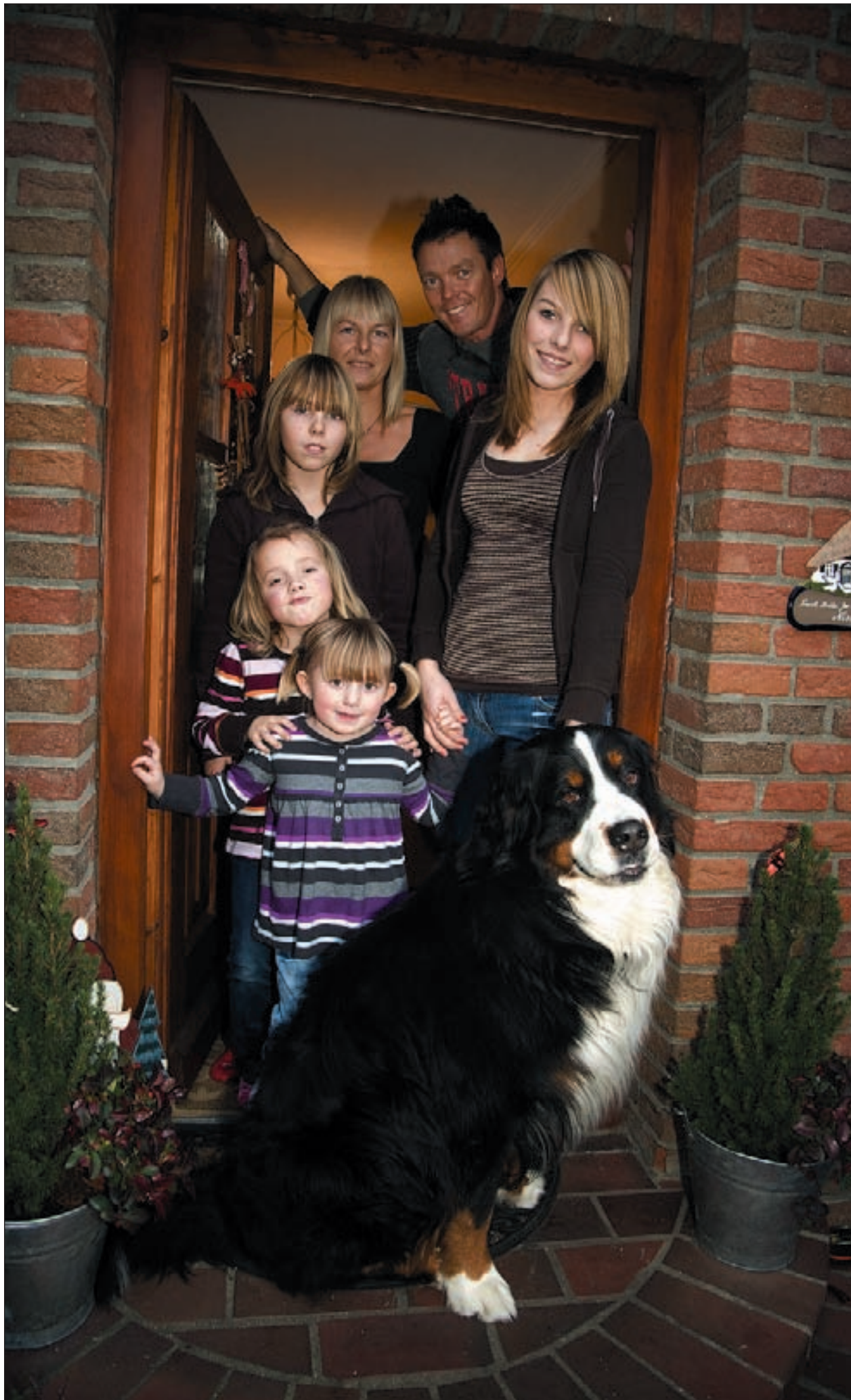
Familien Nissen fra Flensborg: »Vi er perfekt gennemorganiseret«.