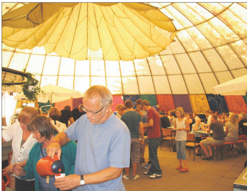
Man kan på billedet fornemme stemningen i »Boblen«, som er de frivillige medarbejderes kantine ved Tønder Festivalen. Her kan alle ca. 2000 aktive købe deres mad. Maden er af god kvalitet og bærer præg af, at den er veltilberedt og bliver serveret med glæde. »Aktive kvinder« samarbejder i kantine med deres mænd.