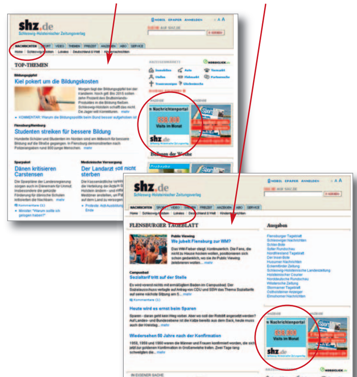
Anzeige auf der Homepage oder auf einer Lokalseite

Online buchbar unter: www.shz.de/onlineanzeigen