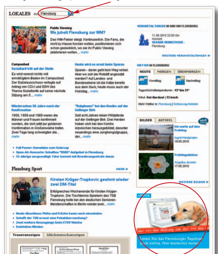
Anzeige auf der gespeicherten Regionalseite