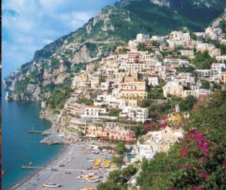
Alle Bilder dieses Folders sind urheberrechtlich geschützt.

Gerichtsgebäude. Nachmittags Auffahrt hinauf zum Vulkan durch den Parco Nazionale del Vesuvio. Der Bus hält auf ca. 1.000 m, von dort aus geht es zu Fuß weiter hinauf zum Kraterand. Ein autorisierter Bergführer gibt Einblick in das Leben des einzigen aktiven Vulkans auf dem europäischen Festland. Der Vesuv zählt zu den am meisten erforschten und bekanntesten Vulkanen der Erde. Genießen Sie den unglaublichen Ausblick auf den Golf und seine Metro-pole. Rückfahrt zum Hotel. (F, A)