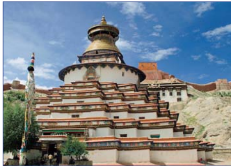
Gyantse, Palkhor-Kloster, Kumbum-Tschoerten

9. Tag: SHIGATSE – LHASA Sie besuchen heute das Tashi Lhunpo-Kloster, das zu den bedeutendsten Sehenswürdigkeiten Tibets gehört. Der 150.000 qm große Komplex, „Berg des Ewigen Segens“, wurde im 17. und 18. Jahrhundert erheblich erweitert und besitzt eine gewaltige, 26 m hohe Buddha-Statue, die ganz aus Bronze gegossen wurde. Sehr sehenswert sind auch die herrlichen Wandmalereien in der Grabkapelle des 1. Dalai Lama. Die Klosterstadt mit heute wieder etwa 600 Mönchen ist täglich Ziel vieler Pilger, die die zahllosen Butterlämpchen auffüllen und kleine Opfergaben darbringen. Rückfahrt mit dem Bus nach Lhasa. F/M/A