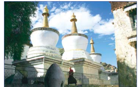
Shigatse, Tashi Lhunpo Kloster

7. Tag: LHASA Heute brechen Sie zum Besuch des Klosters Drepung und zum Dschokhang-Tempel auf. Das Kloster Drepung, der „Vatikan“ des Lamaismus, befindet sich 10 km nordwestlich von Lhasa und wurde 1416 von Anhängern des Gelbmützen-Ordens (Gelupka) im typisch tibetischen Stil erbaut. Hier befinden sich die Grabstümpfe des 2., 3. und 4. Dalai Lama. Der Dschokhang-Tempel ist das bedeutendste Heiligtum im tibetischen Buddhismus und Ziel vieler Pilger der Region. F/M/A