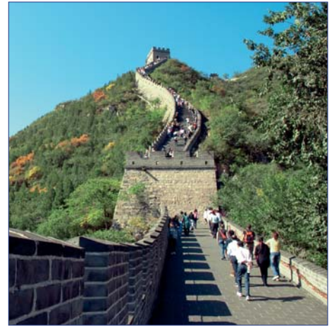
Peking, Große Mauer

Der Himmelstempel aus dem Jahre 1420 symbolisiert Himmel und Erde. Ohne einen einzigen Nagel erbaut, erhebt sich der Himmelstempel oberhalb der Marmorterrasse und glänzt mit seinem Dach aus 50.000 blauen Glasurziegeln. Erst kürzlich renoviert, erstrahlt er in neuem Glanz und ist ein einzigartiges Fotomotiv. F/M