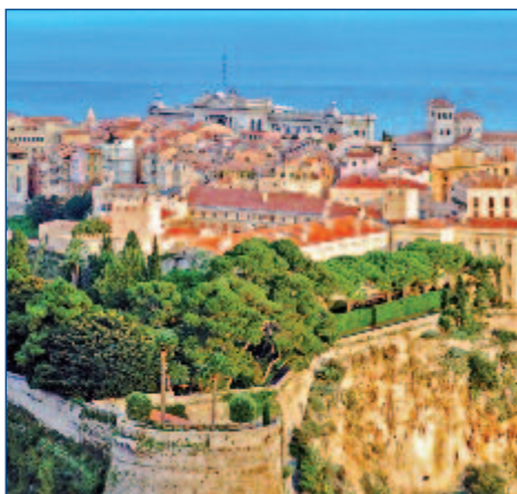
Blick über den Fürstenhof von Monaco

Stand: Dez. 2011, Änderungen vorbehalten.