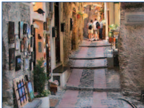
Bummeln in romantischen Gässchen