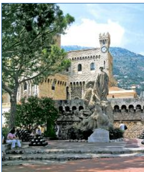
Im Fürstenpalast von Monaco