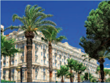
Mondäne Architektur in Cannes