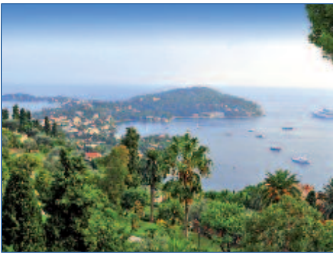
Die Cote d'Azur