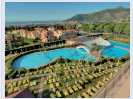
Gartenanlage des Hotel Loano 2 Village