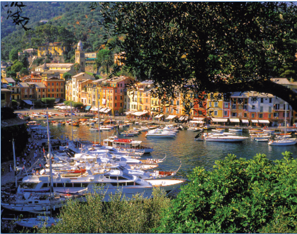
Der landschaftlich beeindruckende Naturhafen von Portofino (Zusatzausflug)

R omantische Altstädte, mondäne Badeorte und kulinarische Köstlichkeiten entdecken Sie auf Ihrer Reise an die Blumenriviera. Entlang der malerischen Küstenstraße fahren Sie in Frankreich von der sonnigen Filmstadt Cannes über Nizza, der Hauptstadt der Côte d'Azur, bis zum Kleinstaat Monaco. Auf italienischer Seite lernen Sie das ursprüngliche Ligurien kennen. In kleinen Bergdörfern im Hinterland genießen Sie landestypische Pasta-Spezialitäten und probieren regionale Weine. An der von Blumenfeldern umgebenen, alten Römerstraße Via Aurelia liegt San Remo. Das Zentrum der Blumenriviera lädt Sie mit ihrer romantischen Altstadt zum Bummeln ein.