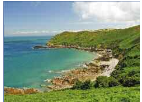
Grün bewachsene Felsküsten

06.06. BIS 13.06.2012 • FLUG AB/AN HAMBURG • AB € 999,- P.P. IM DZ