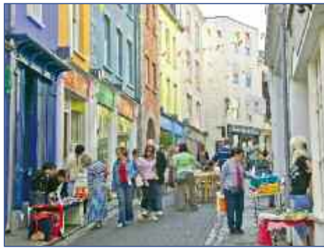
Shopping in St. Peter Port