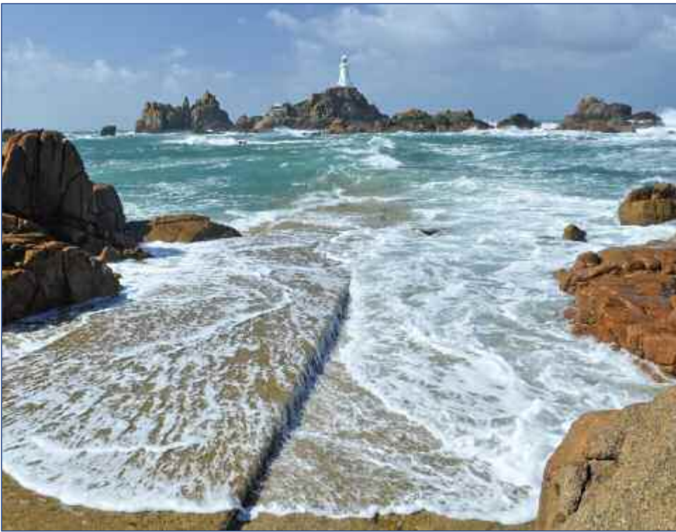
Leuchtturm La Corbière

A ufgrund der Lage am Golfstrom haben die britischen Kanalinseln ein „Klima, das für den Müßiggang wie geschaffen ist“ (Victor Hugo, 1855). Atemberaubende Küstenabschnitte und entzückende Fischerhäfen verzaubern jeden Besucher. Jersey, die größte der Kanalinseln, hält Englands Sonnenscheinrekord. Kilometerlange Sandstrände, dazwischen romantische Buchten und bunte Blumentepiche, wechseln sich ab mit Palmen und einer üppigen Vegetation im Inselinneren. Zahlreiche Küstenwege laden zu erholsamen Spaziergängen ein. Man kann sich kaum einen besseren Ort vorstellen, um sich in der frischen Meeresluft zu entspannen und vom Alltagstrott zu erholen. Dazu die Wärme und Freundlichkeit der Inselbewohner, die von einer wohltuenden Mischung aus britischer Gemütlichkeit und französischer Lebensfreude geprägt sind – entdecken Sie mit uns dieses ausgefallene Zielgebiet mitten in Europa. Britischer Lifestyle und französisches Savoir-vivre werden Sie noch lange begleiten.