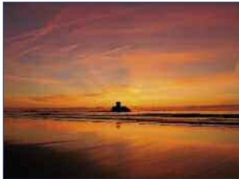
Sonnenuntergang über dem Atlantik