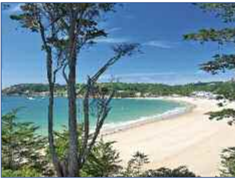
St. Brelades Bay