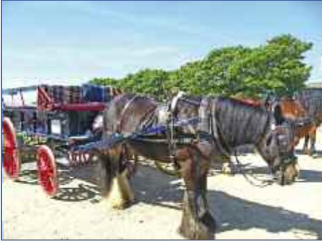
Pferdekutsche auf Sark