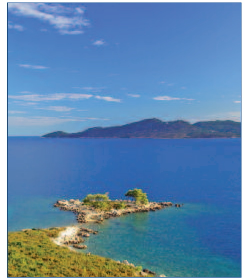
Kroatien - eine mediterrane Schönheit