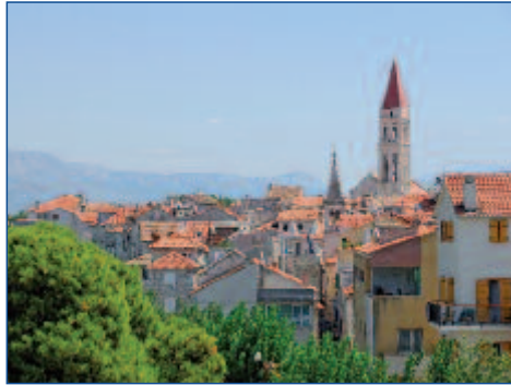
Blick über die Altstadt von Trogir