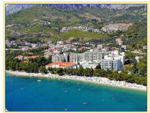
Ihre Hotels liegen direkt am Meer