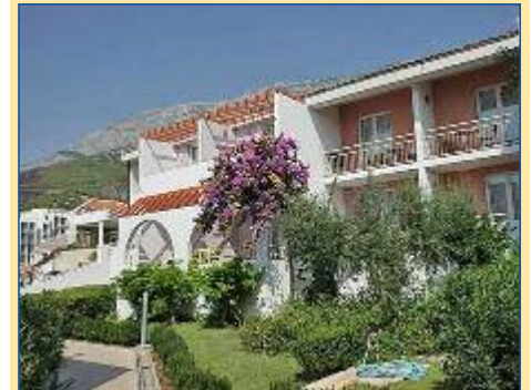
Gartenanlage des Hotel Afrodita

Nach der Fahrt über einen Gebirgspass erleben Sie oberhalb des ursprünglichen Seeräuberstädtchens Omis ein atemberaubendes Panorama auf die tiefe Schlucht des Cetina-Flusses, das weite Meer und das beschauliche Küstenstädtchen. Tausend Jahre lang gestaltete die Cetina wundersame Formen in das Gestein des gewaltigen Canyons. Von Omis aus führt Sie eine gemütliche Bootsfahrt flussaufwärts durch die wildromantische Cetinaschlucht zu einem idyllisch gelegenen Uferrestaurant, wo man Sie mit typischen einheimischen Spezialitäten verwöhnen wird. Anschließend machen Sie noch einmal Halt in Omis, wo Ihnen genügend Zeit für einen Rundgang durch den mittelalterlichen und