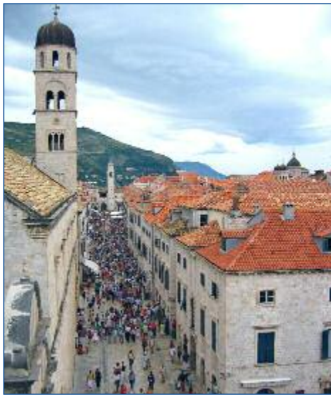
Die Altstadt von Dubrovnik