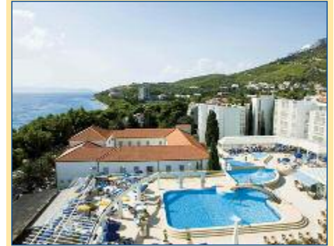
Pool des Hotel Alga

wurden 2004 abgeschlossen und schon ein Jahr nach der feierlichen Wiedereröffnung wurden die Brücke, ein Symbol für Hoffnung und Versöhnung, und die Altstadt von Mostar zum Kulturdenkmal der UNESCO erklärt. Die Rückfahrt zu Ihrem Hotel führt Sie entlang der alten Napoleon-Straße durch das Hinterland von Biokovo – von hier aus genießen Sie einen wunderschönen Blick auf die mitteldalmatinische Inselwelt. Hinweis: Für diesen Ausflug benötigen Sie einen gültigen Reisepass oder Personalausweis.