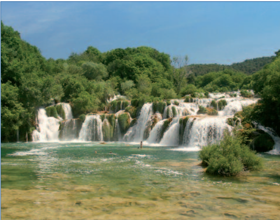
Atemberaubende und glitzernde Krka-Wasserfälle

E ine Reise nach Kroatien verspricht weit mehr als Badefreuden an der herrlichen Adriaküste. Entdeckungsfreudige Besucher kommen in Dubrovnik, der Stadt der Kreuzritter, Pilger und Abenteurer voll auf ihre Kosten. Klöster, Kirchen, Museen und Paläste sind Zeugen eines reichen kulturellen Erbes. Und das Schönste an Dubrovnik ist, dass man alles bequem zu Fuß erreichen kann. Kontrastreiche Eindrücke vermitteln auch die Ausflüge nach Šibenik, Mostar, Split und Trogir. Von atemberaubender Schönheit sind die Krka-Wasserfälle. All dies, das reiche kulturelle Erbe, ein vielseitiges und reizvolles Landschaftspanorama, dazu gastfreundliche Menschen und ein angenehmes mediterranes Klima machen Kroatien zu einem äußerst lohnenden Reiseziel.