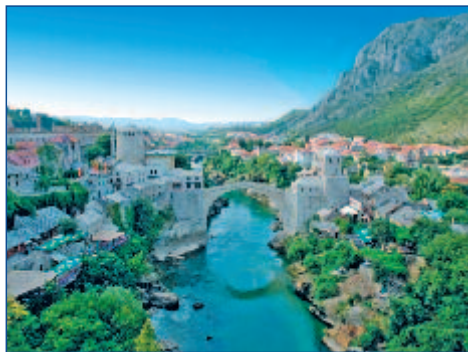
Die Brücke „Stari Most“ in Mostar