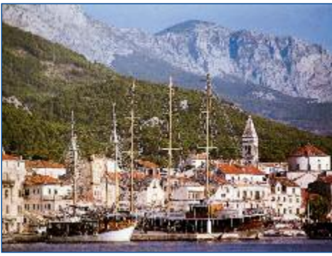
Die Küstenstadt Makarska