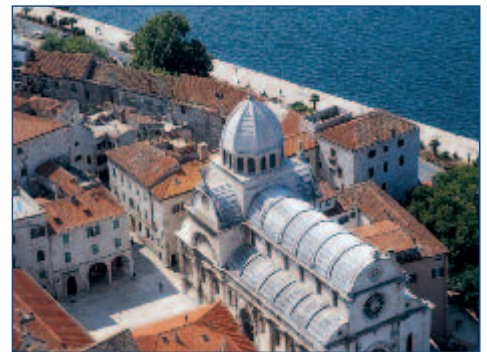
Die Kathedrale in Šibenik

10.05. BIS 17.05.2012 • FLUG AB/AN HAMBURG • AB € 746,- P.P. IM DZ